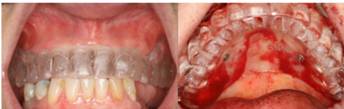
Figura 4 - Guia Cirúrgico obtido a partir da prótese total

O tratamento reabilitador, através de implantes, deve ter início com a construção de próteses diagnósticas, quando o profissional poderá adiantar o resultado final. Essa prótese é transformada em guia cirúrgico, otimizando o resultado final do tratamento, com a determinação da posição, número e inclinação dos implantes. (CARVALHO NB, et al., 2006).