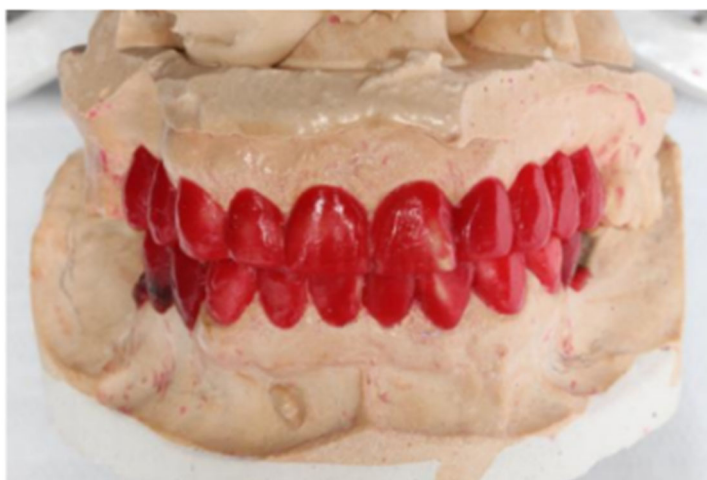
Figura 1 - Enceramento Diagnóstico

De acordo com Yim et al., (2011) para que se obtenha um adequado plano de tratamento em implantodontia é indispensável o uso de imagens que promovam um bom prognóstico. Devido a maior resolução das imagens obtidas, as tomografias computadorizadas (TC) se tornaram o método mais confiável dos cirurgiões dentistas, especialmente os implantodontistas.