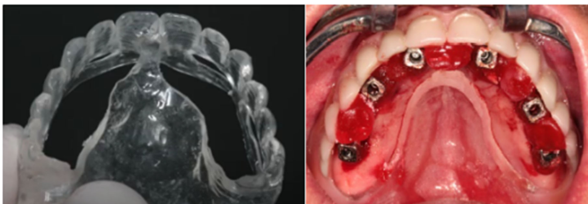
Figura 3 - Guia Cirúrgico

Há diferentes desenhos para as próteses fixas sobre implantes e a escolha do mais adequado é primariamente dependente da quantidade de implantes no arco. O modelo clássico é a prótese tipo protocolo definida por Branemark, que se caracteriza pela colocação de 4 a 6 implantes na região anterior da mandíbula, entre os forames mentuais, e cantilever distal de ambos os lados para substituir os dentes posteriores. Na maxila recomenda-se a colocação de 6 a 8 implantes. Nesse tipo de prótese utiliza-se uma infra estrutura metálica e uma base de resina para uni-la aos dentes de resina acrílica. Os guias cirúrgicos nesses casos orientaram as inclinações méso-distal e vestibulo-palatal, além da extensão do cantilever.