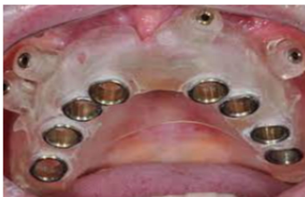
Figura 5 - Guia Cirúrgico Prototipado

As dimensões do local a ser inserido um implante, a quantidade e a qualidade do osso disponível, a ausência de patologias ósseas, a inclinação do processo alveolar remanescente são fundamentais para o cirurgião, sendo que altura,